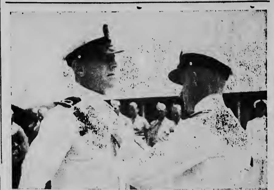
Ook de adjudant onderofficier der Mariniers kreeg een hoge onderscheiding uitgereikt: de zilveren ere-medaille verbonden aan de Orde van Oranje Nassau. Hier krijgt hij de medaille door majoor Veenhuys opgespeld.

Lang bleven de gasten daarna nog in een genoeiglijke sfeer bijeen.